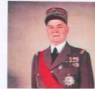
Maréchal Aphonse JULN Né le 12/10/1866 à Boufarik Chef du corps expéditionnaire français en Tunisie puis en Italie, promoteur de la victoire du Garigliano qui ouvrit aux otâs la route de Rome. Second maréchal de France né en Algérie avec FRANCHET D'ESPÈREY