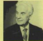
Paul BELMONDO Alger 1898-Paris 1982 Sculpteur de génie Grand Prix Artistique de l'Algérie en 1932 Professeur à l'Ecole des Beaux Arts de Paris dès 1952 Membre de l'Institut en 1960