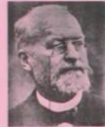
Aphonse LAVERAN Médecin militaire qui découvrit en 1880 à Constantine l'agent causal du paludisme et sa transmission par le moustique Premier français Prix nobel de médecine en 1907