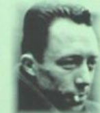
Albert CAMUS Né à Mondovi, élevé à Belcourt Brillantes études au lycée Bugeaud d'Alger Journaliste, Ecrivain Prix Nobel de Littérature en 1957 Mort accidentellement en 1960