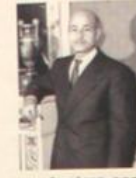
Dr Chérif SID CARA Né le 1905 à Guelma Dernier maître de Masséguin Elu dès 1948 il fut Ministre Député et Sénateur Nafissa SID CARA Sa sœur, fut la première femme musulmane ministre de 1959 à 1962