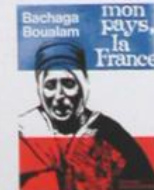
Bachaga Bouatam Vice-Président en 1958 de l'Assemblée Nationale Officier français, notable musulman, il a donné à la France son fils, 17 de ses proches parents et 2000 de ses hommes des Beni-Boudouane