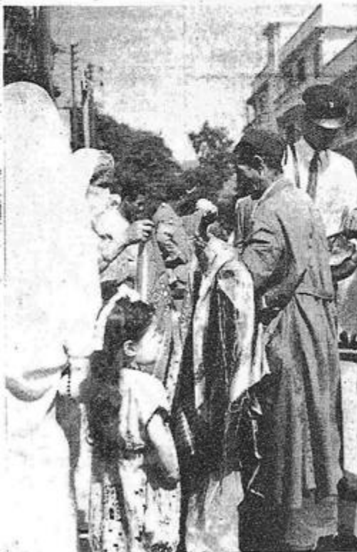
Les femmes musulmanes profitent de l'Aid pour faire quelques emplettes auprès d'un marchand ambulancier (INFORMATION PAGE 12)