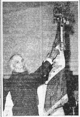
Le drapeau de l'Elan a reçu hier la médaille d'or du mérite national français.

UNE DYNAMIQUE « QUADRA »... L'ELAN DE BAB-EL-OUED a fêté son quarantième anniversaire