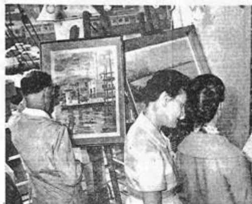
A bord du « Sidi-Mabrouk » a eu lieu le vernissage du Salon de la mer en présence de nombreux personnalités. Le vernissage du « Sidi-Mabrouk ».

Succès du vernissage du 2 e Salon de la mer à bord du "Sidi-Mabrouk"