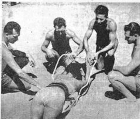
Les C.R.S.-sauveteurs de la Madrague devant un des baigneurs — en sa dignité qui s'aime de l'Algérie... Les plages algéroises sont en état de réorganisation... Paris, dimanche 10 juin 1961.

Le problème des plages algéroises n'est pas pour autant résolu