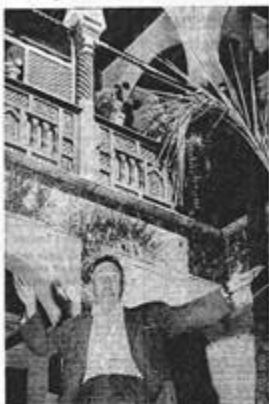
Le comité du vieil Alger tente de sauver les splendeurs de « Dar-el-Mamra » vestige du quartier des Raïs.

RUE PHILIPPE Le comité du vieil Alger tente de sauver les splendeurs de « Dar-el-Mamra » vestige du quartier des Raïs