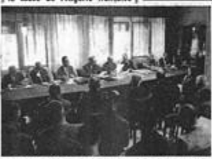
Assemblée générale de la C.G.A. à Alger.