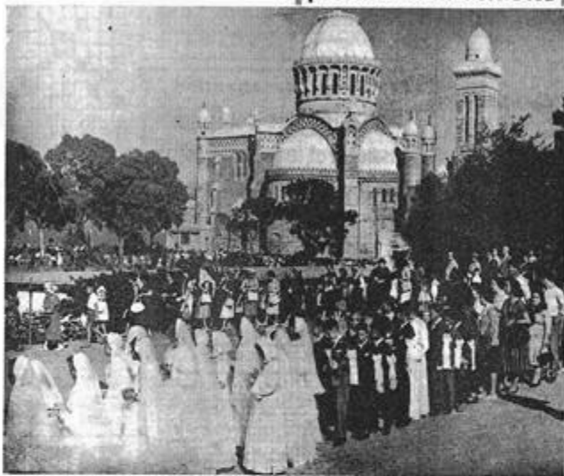
Une vue de la procession, hier après-midi, à Notre-Dame-d'Afrique (INFORMATION PAGE 11)

Hier après-midi, à Notre-Dame-d'Afrique Des milliers de fidèles ont assisté à la traditionnelle procession de la Fête-Dieu