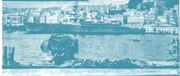
CI-DESSUS : Le croiseur-école arrive dans le port d'Alger. — CLOCHE DU MAUTY : Une vue de la belle ville algérienne prise par le croiseur-école.

Le « Général-Mangin », en provenance de Casablanca, a franchi la passe à 13 h. 40 pour repartir à 19 h. 30 à destination de Palma, où il effectuera une escale touristique de quelques heures, et Marseille. Placé sous les ordres du commandant Roumegoux, le navire, coulé par la Wehrmacht, transportait 180 passagers en première classe, 170 en seconde, 117 en troisième et 63 en quatrième, soit un total de 530 passagers.