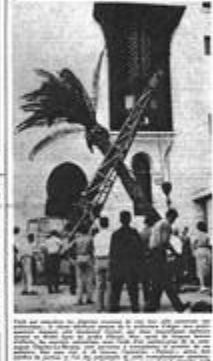
Le monument de la Callee, au bord du port d'Alger.