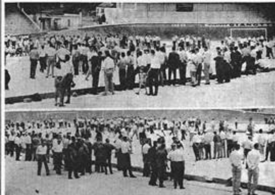
Une scène dans le premier tournoi des championnats fédéraux de hockey. On aperçoit au premier plan le drapeau de la compétition de hockey d'Algérie, sous lequel se tient une foule nombreuse et enthousiaste pour assister à la première partie de cette importante compétition qui sera suivie par une centaine de milliers de spectateurs au stade de la Ville d'Alger.

Les manifestations boulistes de L'ÉCHO D'ALGER Succès considérable au municipal pour les championnats fédéraux