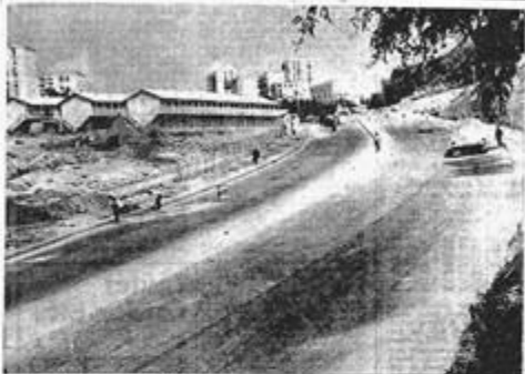
L'aménagement des nouvelles voies de Grand-Alger se poursuit. Dans la partie des travaux prévue entre le centre d'Alger, on trouve à droite une section de la route de la Fosse-Boulogne à Babouat, ainsi qu'une section de la circulation. Plus à droite, on trouve la section de la route de la Fosse-Boulogne à Babouat, ainsi qu'une section de la circulation. Plus à droite, on trouve la section de la route de la Fosse-Boulogne à Babouat, ainsi qu'une section de la circulation.

L'AMÉNAGEMENT DU GRAND-ALGER : UNE NOUVELLE VOIE OUVERTE A LA CIRCULATION