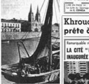
La Callee, au bord du port d'Alger, au pied de la Casbah.

— Neuf fois détruite, la ville a toujours resurgi de ses ruines