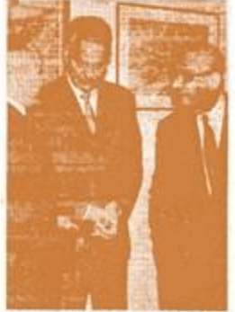
Reception de l'Association des amis de Guynemer par le club des 3 A.

À SON SIÈGE, BOULEVARD CARNOT L'Aéro-Club d'Algérie a reçu l'Association des amis de Guynemer