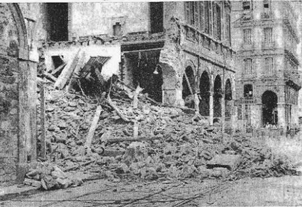
Des gravats de l'immeuble, rue Bab-el-Oued (INFORMATION PAGE 14)

L'immeuble vétuste de la rue Bab-el-Oued s'est en partie effondré