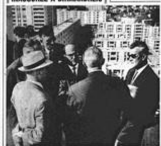
L'inauguration de la Cité "La Concorde" à Birmandreis.

immédiat sur le désarmement LA CITÉ "LA CONCORDE" INAUGURÉE À BIRMANDREIS