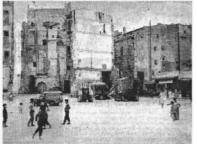
Pas à pas, le terrain du futur quartier de la Marine se libère de ses innombrables débris. Les terre-pilotes ainsi libérés ne pourront pas donner d'excellents parkings, même provisoires ?

Après l'effondrement de leur immeuble vétuste Les sinistrés de la rue Bab-el-Oued (14 familles européennes et musulmanes) ont été recasés en moins de 24 h. Ne peut-on faire un « parking » du terrain ainsi libéré ?