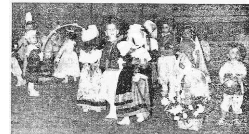
La « Ronde de la marée » par les enfants de la crèche de l'E.G.A. Hier, au stade, la police surveillait... (Text is partially obscured)

HIER, A LA SALLE BORDES Succès d'affluence pour la fête des mères du personnel des industries électriques et gaziers