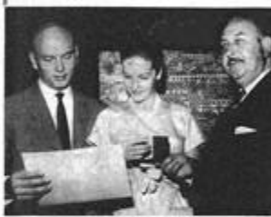
Yul Brynner, citoyen d'honneur de la ville de Paris, avec sa femme et son enfant.

Yul BRYNNER, citoyen d'honneur de la ville de Paris